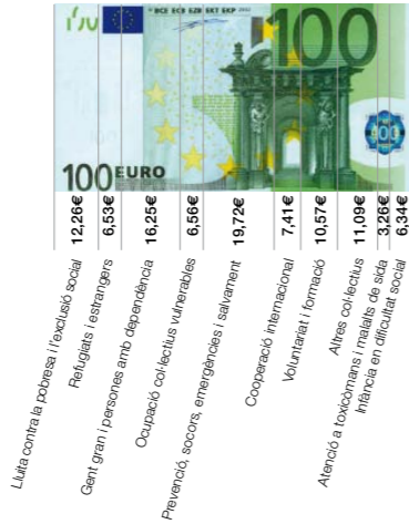
DISTRIBUCIÓ PER ACTIVITAT D'UNA DONACIÓ DE 100 €